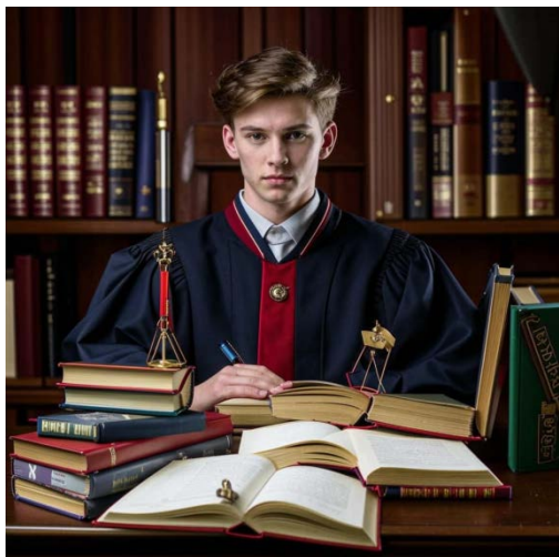
Изображения созданы с помощью нейросети Кандинский