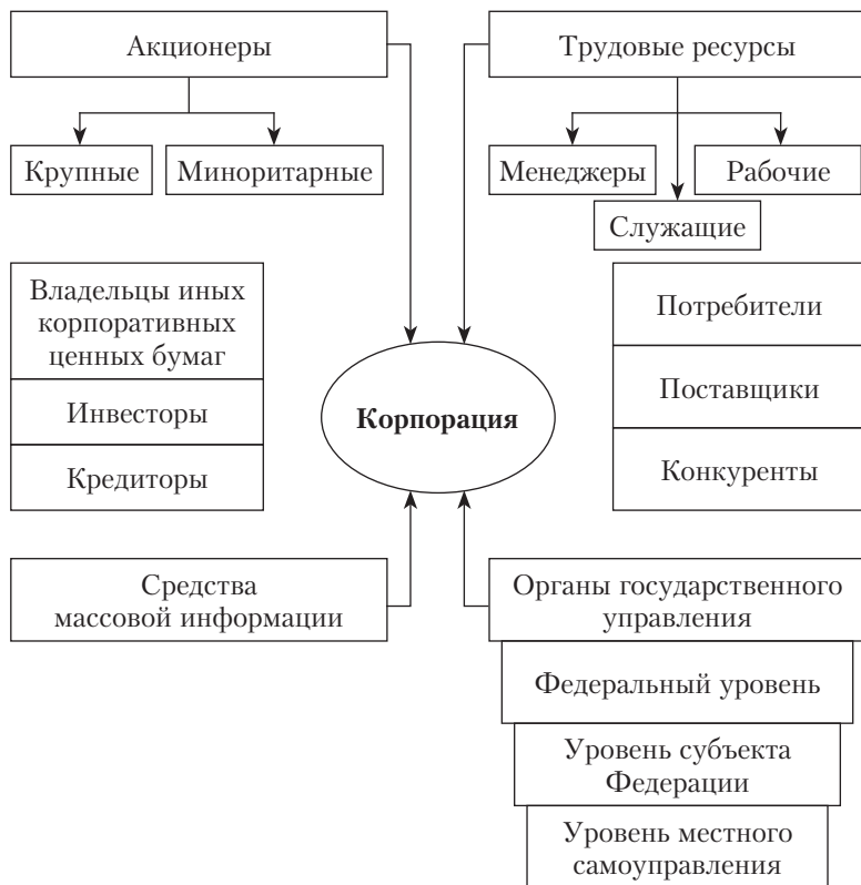
Рис. 1.1. Участники корпоративных отношений 1