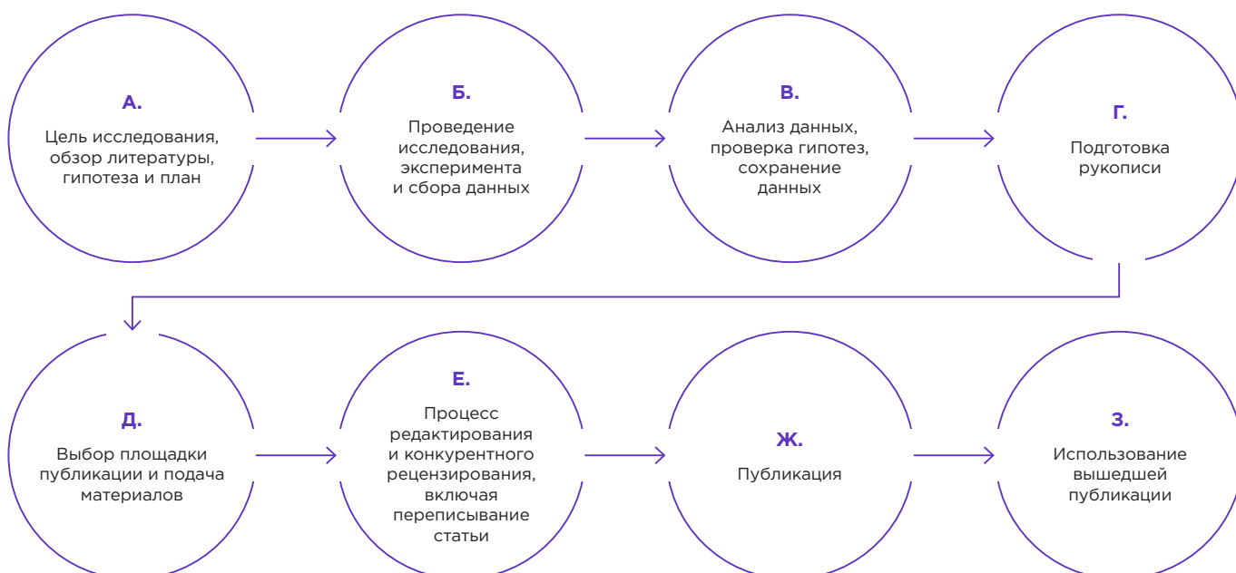
Рисунок 2. Ключевые этапы обеспечения добросовестного проведения и публикации исследований: не только фабрикация, фальсификация и плагиат

Но новые типы нарушений, о которых идет речь, выходят за пределы просто сомнительных практик. Особенно в последние годы исследователи и журналисты обращают внимание на манипулирование списками публикаций и индексом цитирования в целях повышения формальных показателей отдельных лиц или журналов, которые во многих случаях могут привести к личной и коммерческой выгоде (Biagioli и др. 2019, 2020a, 2020b, Charman и др. 2019). Если Мертон подчеркивал значение первенства научного открытия как главной награды для исследователей (1957), то сегодня сами научные достижения могут иметь меньший вес и служить лишь «средством обмена», чем выдающийся из общего ряда список публикаций с высоким индексом цитирования. С этой целью все виды нарушений в настоящее время направлены на достижение внешне впечатляющих количественных результатов и «налета престижа» для отдельного человека или журнала, хотя под этим тонким налётом позолоты может скрываться неблагородный металл.