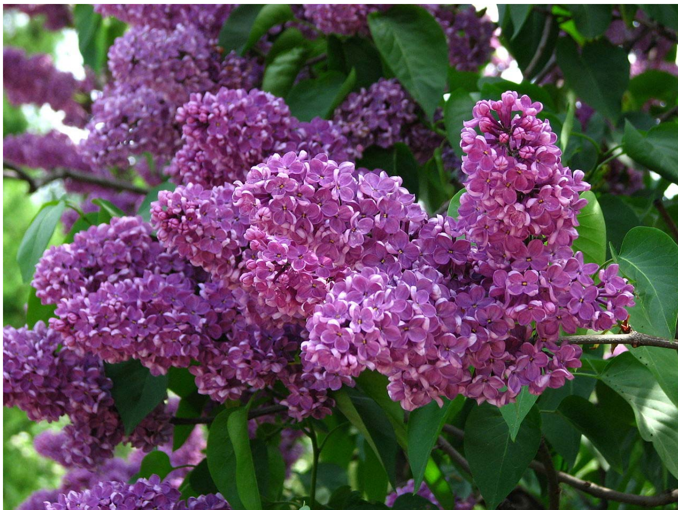
Сорт «Леонид Леонов»