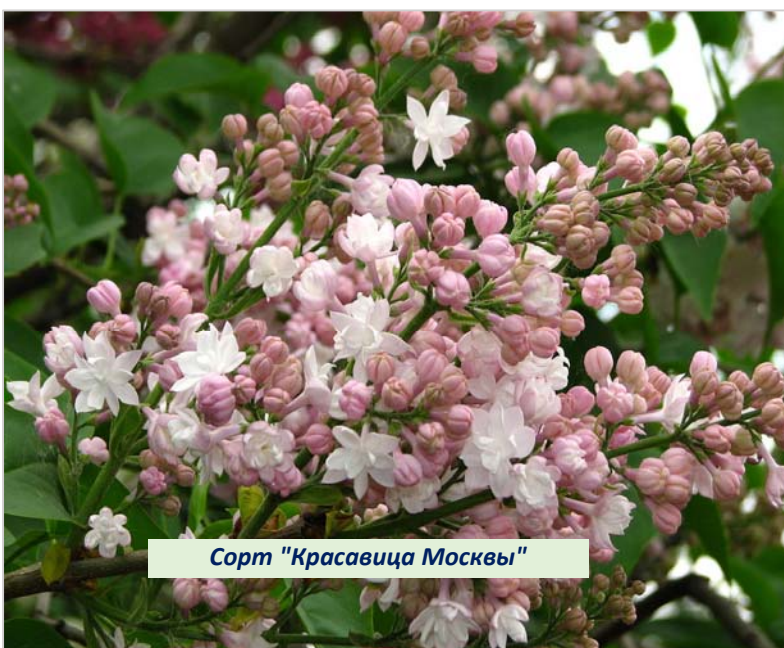
Сорт "Красавица Москвы"