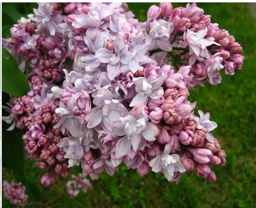
Сорт «Маршал Василевский»