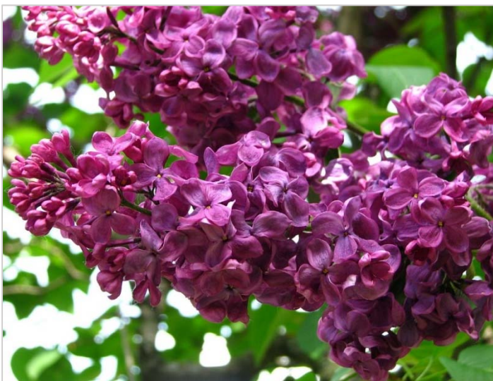
Сорт «Красная Москва»

В 1913 году Леонид окончил Реальное училище Воскресенского; годом позже поступил на экономическое отделение Московского коммерческого института, где проучился до июня 1916 года. Далее последовал призыв в армию; во время Первой мировой войны Леонид Колесников освоил профессию шофёра.