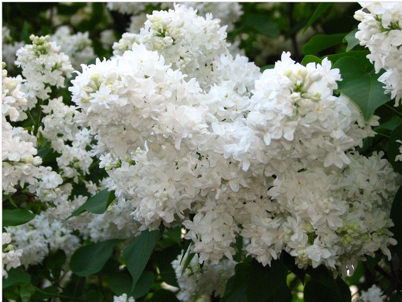
Сорт «Советская Арктика»