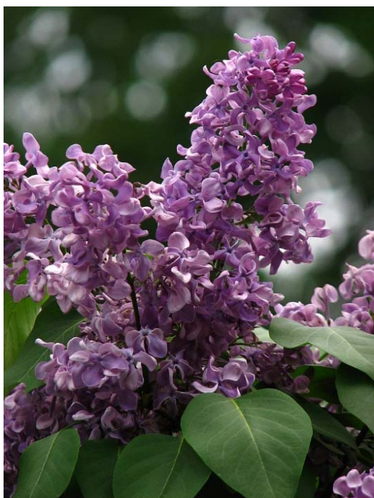
Сорт «Алексей Маресьев»

гордо расправляли миниатюрные лучики, копируя звездочки на военных погонах. Колесников называет свои лучшие сорта в честь знаменитых героев отгремевшей страшной войны.