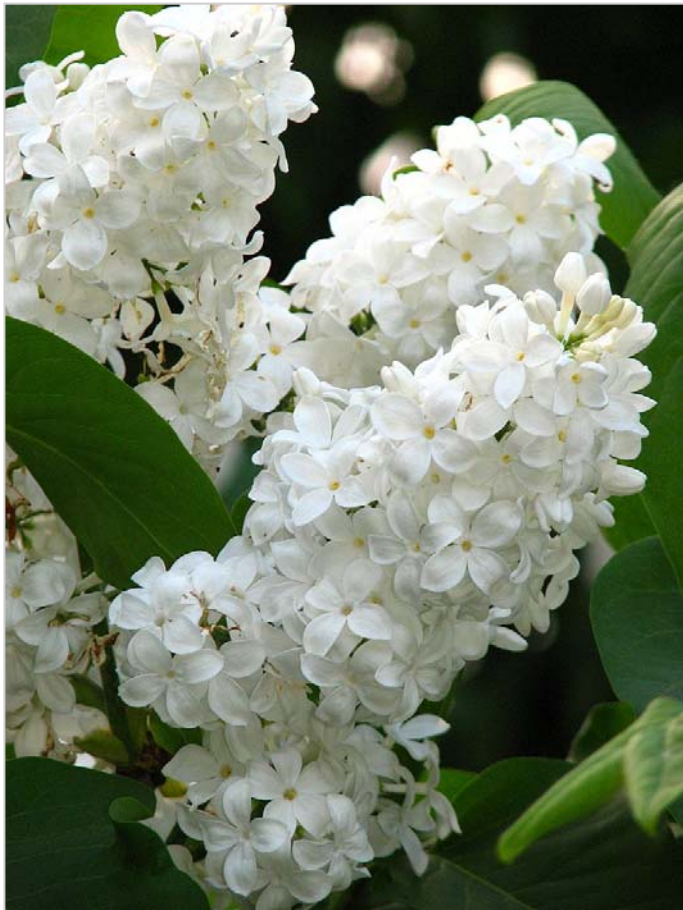
Сорт «Галина Уланова»