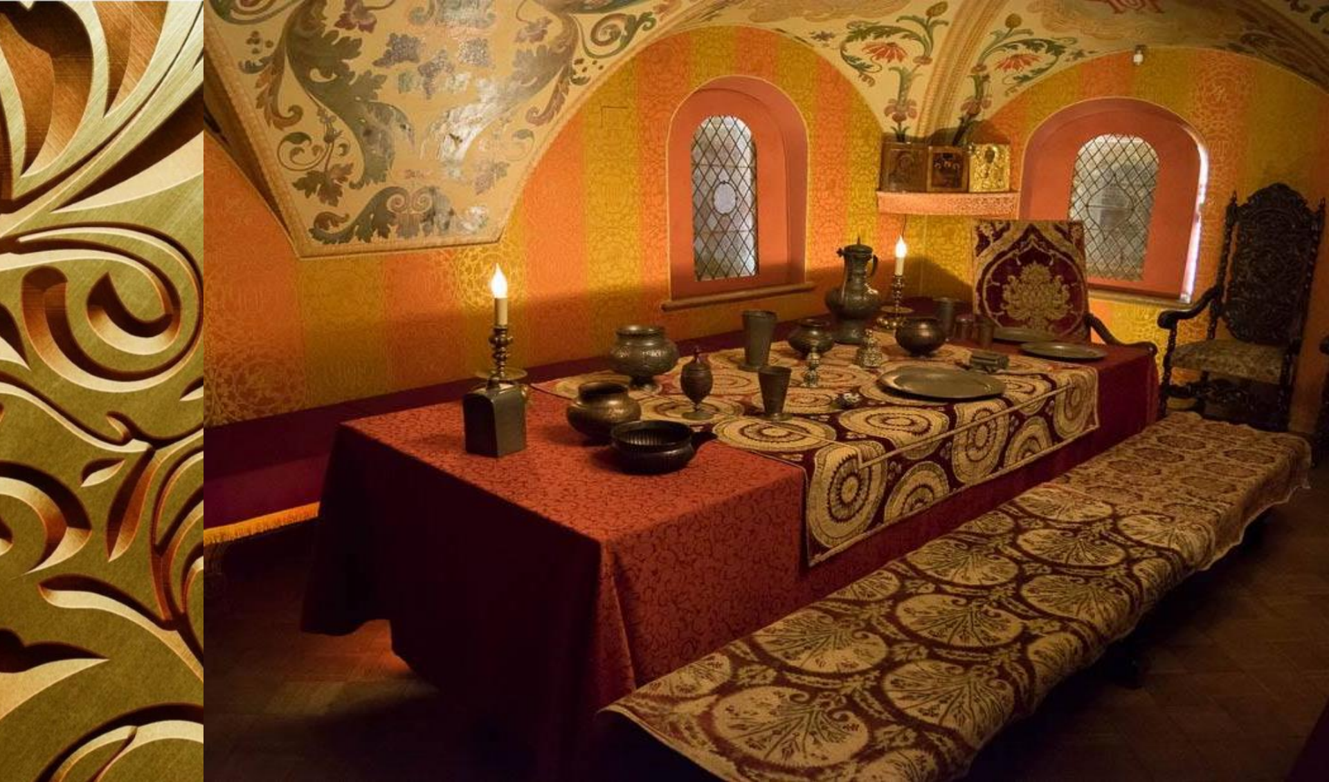
Трапезная палата XVII века.