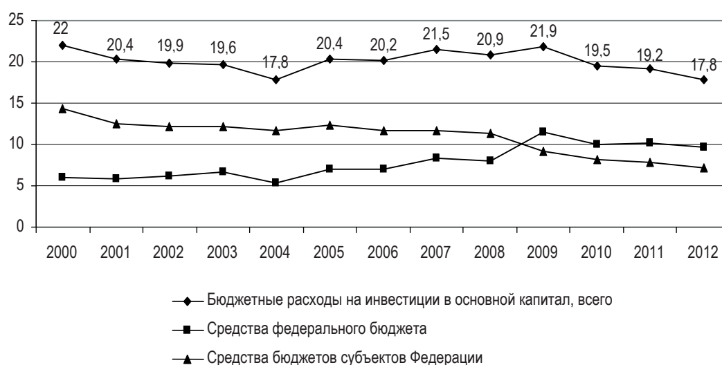
Рис. 3. Доля бюджетных средств в структуре источников финансирования инвестиций в основной капитал в 2000–2012 гг., %

Налоговая система России, сформированная на рубеже 1980–1990-х гг., во многом вобрала в себя накопленный развитыми странами опыт налогового регулирования и стимулирования. Основной целью налоговых пре-